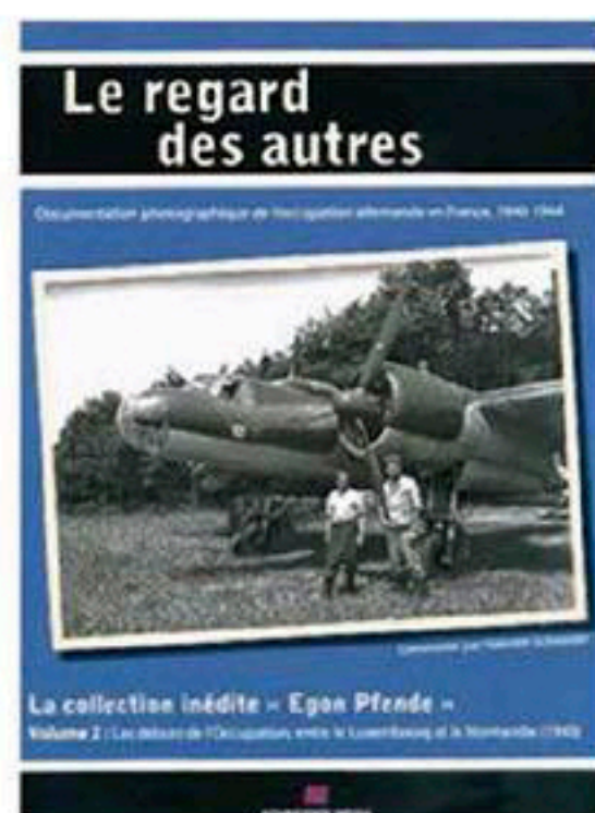
Le tome 2.