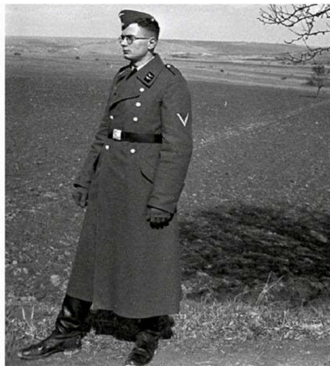
Egon Pfende, l'auteur des photos publiées pour la première fois dans cette collection en 5 tomes (© Schneider Media).