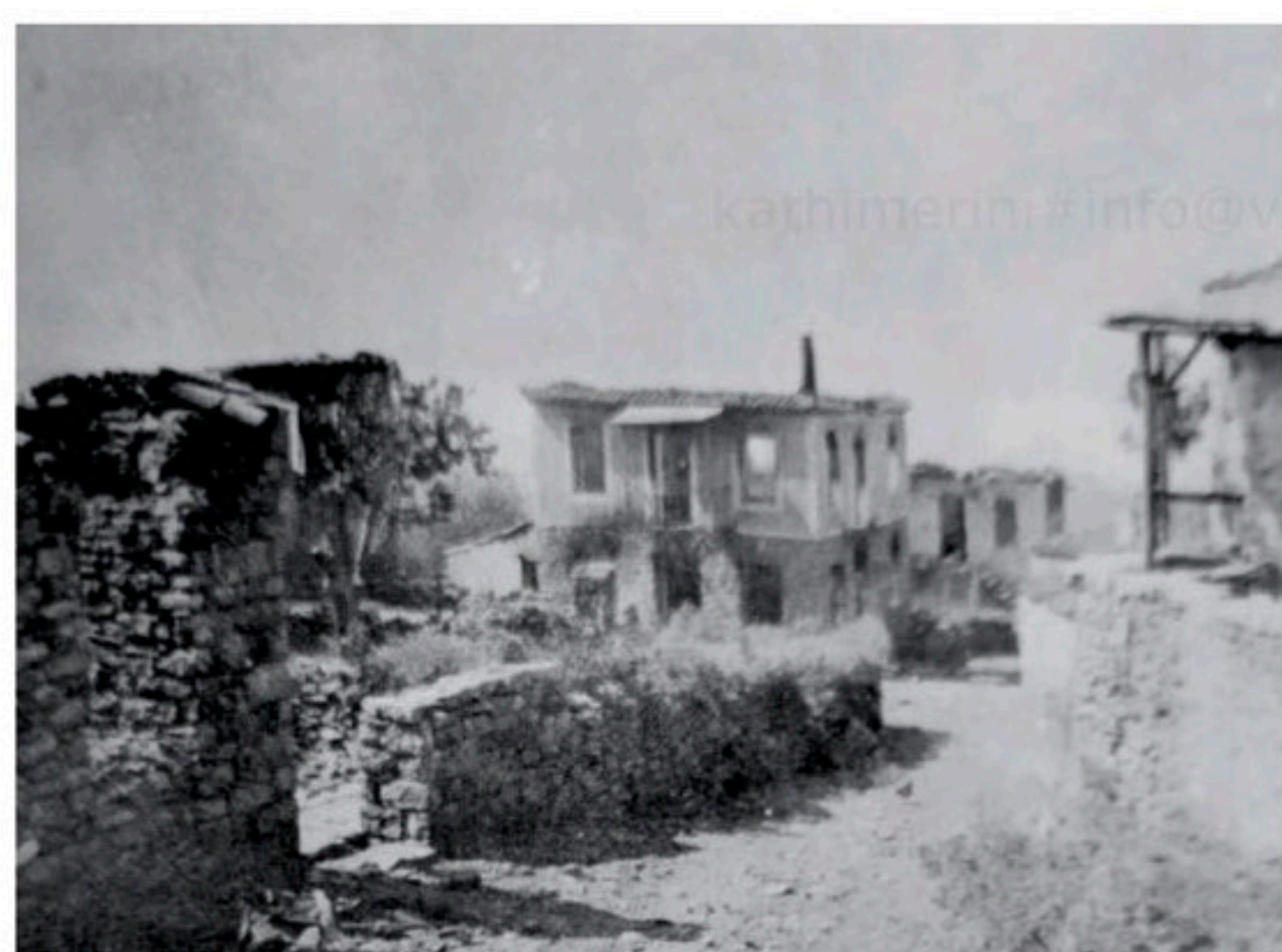
Πριν από τη σχεδόν ολοκληρωτική πυρπόληση της από τους ναζί, η Δόξα αριθμούσε περίπου 1.000 κατοίκους.

έναν ακόμη στρατιωτικό. Υποψιασμένοι για το τι θα μπορούσε να ακολουθήσει οι ντόπιοι εγκατέλειψαν τα σπίτια τους. Το μεγαλύτερο μέρος των κατοίκων καταστράφηκε από τα γερμανικά στρατεύματα, κάποια σπίτια διασώθηκαν είτε γιατί δεν έφτασε μέχρι εκεί η φωτιά, είτε γιατί δεν λειτούργησαν ορισμένοι εμπρηστικοί μηχανισμοί.